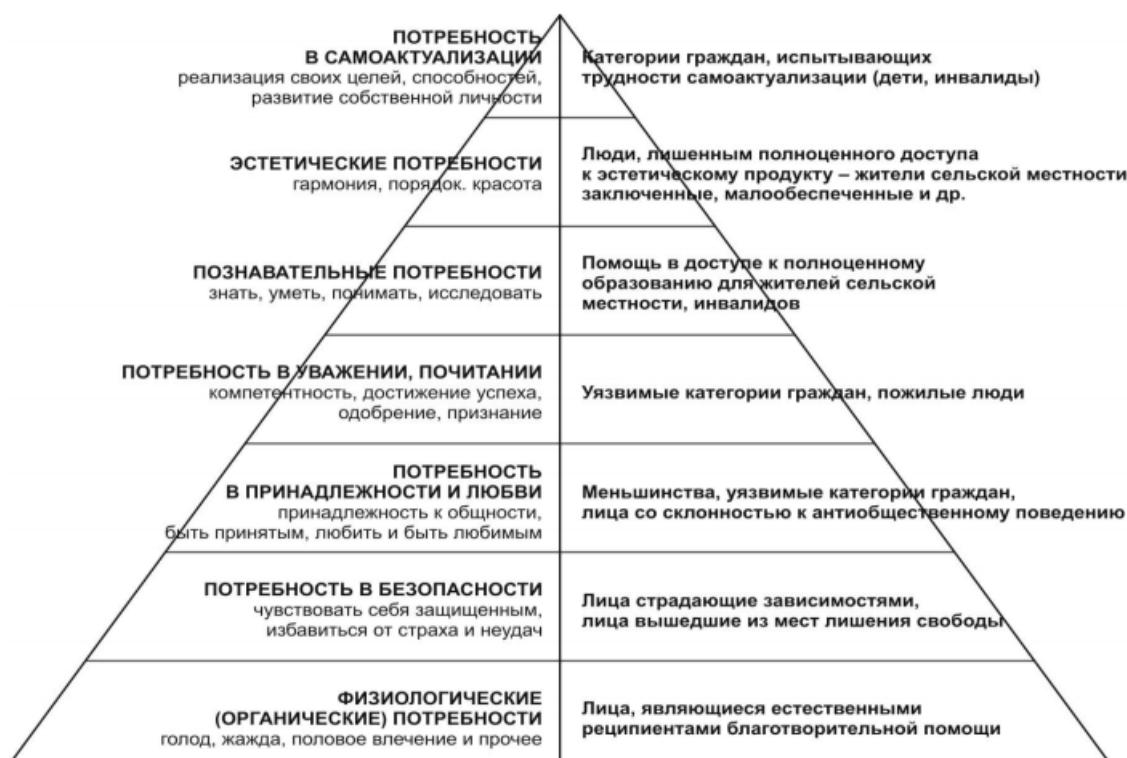
Рис. 2 / Fig. 2. Результаты деятельности социально-ориентированной НКО / The results of the socially-oriented non-profit organization