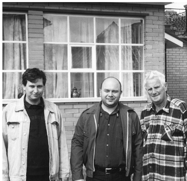
Рис. 3 / Fig. 3. С молодыми коллегами / With the young colleagues