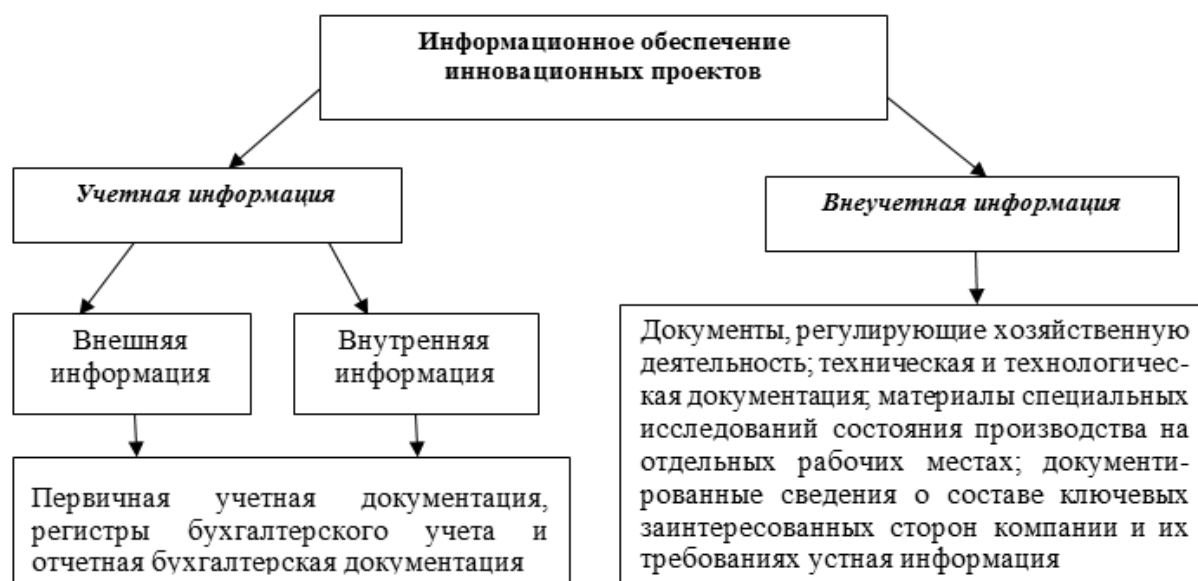
Рис. 2 / Fig. 2. Информационное обеспечение управления инновационно-инвестиционными проектами / Information support for the management of innovation and investment projects