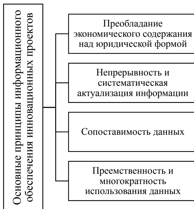
Рис. 1 / Fig. 1. Основные принципы информационного обеспечения инновационно-инвестиционной деятельности в экономических субъектах / Basic principles of information support of innovative and investment activities in economic entities

Сущность стейкхолдерского подхода базируется на том, что устойчивый успех бизнеса может быть достигнут только при соблюдении интересов и требований заинтересованных сторон, способных оказать воздействие на деятельность экономического субъекта. Данная теория предполагает, что фирмы могут становиться более прибыльными и успешными в долгосрочной перспективе за счет устойчивых отношений, выстроенных в результате взаимодействия с заинтересованными сторонами, путем налаживания с ними диалога и учета их требований при принятии управленческих решений. В этой связи современные успешные компании должны не только приносить прибыль, но и обеспечивать уровень благосостояния сотрудников, защиту окружающей среды, поступления налогов в бюджет и социальную сферу, наполнять рынки благ товарами и услугами, востребованными обществом и т.д.